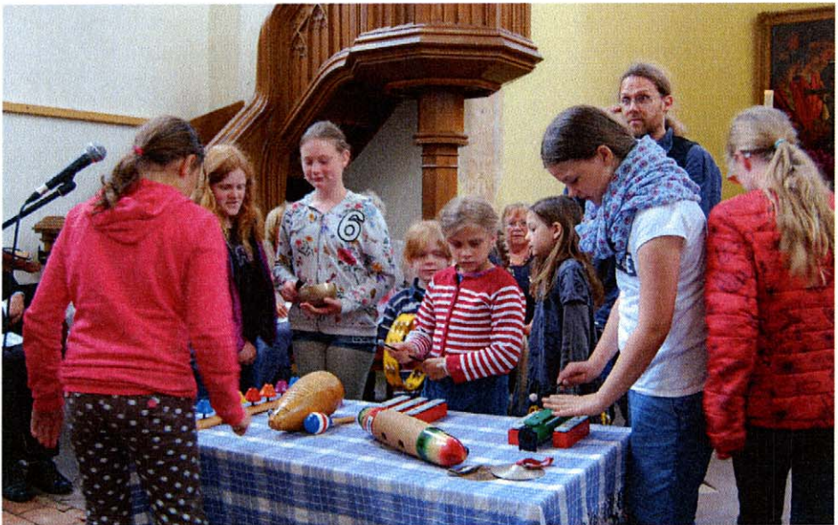
Kinder des Kinderchores singen und spielen beim Himmelfahrtsgottesdienst.